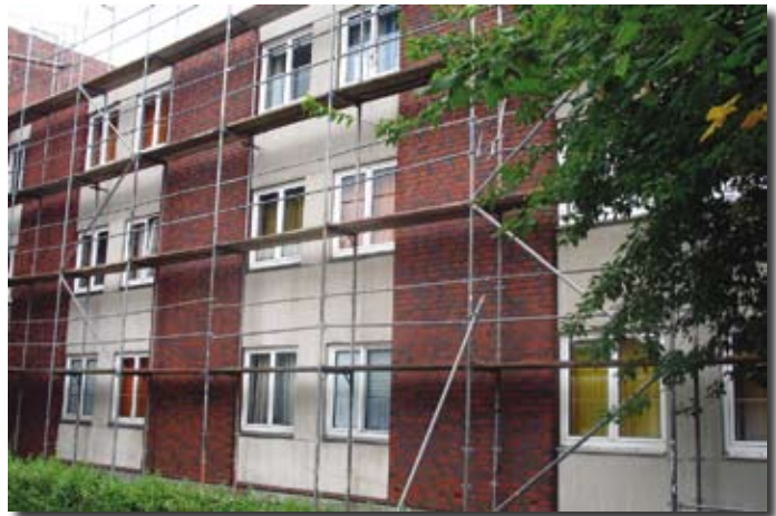
Umfangreiche Fassadensanierungen an der Wohnanlage Wiesenhof in Wilhelmshaven

So gibt es Mieter, die sich auch nach Jahren in den Gruppen wohl fühlen und eben auch ein paar derjenigen, die uns bereits nach ganz kurzer Zeit wieder verlassen, weil die Wohnqualität ihren Ansprüchen nicht gerecht wird.