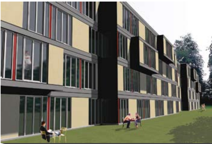
Ansicht der geplanten neuen Wohnanlage

Um der Nachfrage nach Einzelappartements gerecht zu werden, hat sich das Studentenwerk entschlossen, in einem Neubau 132 zusätzliche Appartements zu schaffen und damit das Angebot zu vergrößern. Ein architektonisch reizvoller Neubau in unmittelbarer Nähe zur Universität soll alle Wünsche erfüllen. Die Appartements, angeordnet in drei Häusern mit Laubengang und Glasfassade, modernen Duschbädern und exklusiven Kücheneinbauten versprechen hohen Komfort. Harmonische Farbgestaltung und bodenlange französische Fenster setzen Highlights. Alle Appartements sind in Südwestlage ausgerichtet.