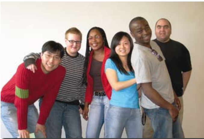
Die Wohnheimtutoren des Studentenwerks

Unsere Wohnheimtutoren helfen, sich im Dschungel von Neuem und Fremdem zurechtzufinden. Sie stehen mit vielen praktischen Tipps zur Seite und leisten