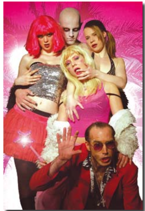
Nicht nur ein großer Publikumserfolg, sondern auch Festival-prämiert: die OUT-Produktion blue_moon

Das im OUT uraufgeführte Stück blue_moon von Ekat Cordes hat beim Publikum und in der Presse eine durchweg positive Resonanz gehabt. Das Stück wurde beim 4. Theaterfestival „Freispiel“ in Freiburg als „Bestes Stück“ mit dem Hauptpreis gekürt. Die Vorstellungen im OUT waren durchweg ausverkauft. Ekat Cordes hat vor