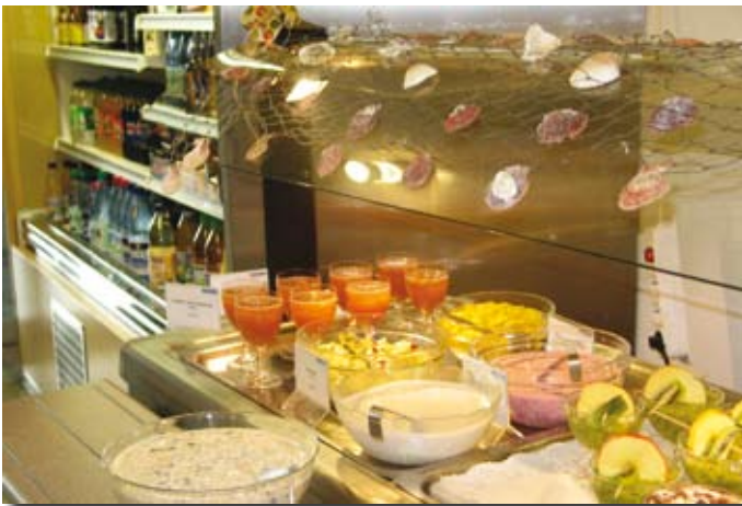
Werden immer vielfältiger und abwechslungsreicher: die Angebote der Verpflegungsbetriebe des Studentenwerks

Dies ist eine Entwicklung, die nicht nur in den Verpflegungsbetrieben der Studentenwerke beobachtet werden kann. Nach wie vor ist die Bedeutung der klassischen Verpflegungsform ungebrochen, gravierende Veränderungen sind bislang nur an den ‚Rändern‘ beobachtbar. Die neue Generation Studierender ist noch in der Minderzahl, aber Veränderungen im Hochschulbereich vollziehen sich bekanntlich verhalten, auch die Anpassungsleistungen des Studentenwerks brauchen ihre Zeit.