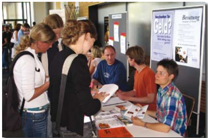
BAföG-Beratung auf dem Hochschulinformationstag

Noch in diesem Jahr ist nun der Aufbau einer eigenständigen Studienfinanzierungsberatung geplant, in der die Beratung zum BAföG nur noch ein Baustein von einer Vielzahl von Finanzierungsmodulen sein wird. Damit soll erreicht werden, dass wir nicht nur diejenigen Studierenden in Finanzierungsfragen beraten, die von uns als nicht mehr förderungsberechtigt nach dem BAföG abgelehnt werden, sondern mit dem Angebot sollen alle Studierenden angesprochen werden.