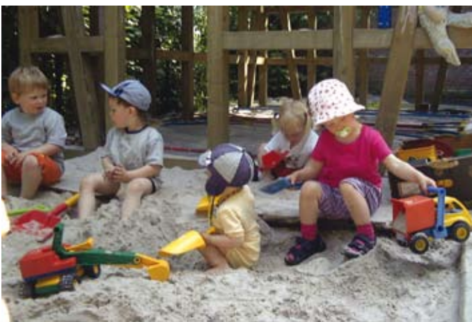
Spiel im Sandkasten in der Kinderkrippe Huntemannstraße

eine weitere Krippengruppe einzurichten. Da die FH nicht in der Lage war, weitere Räume bereitzustellen, erwogen wir zunächst, Räume in unmittelbarer Nähe anzumieten und somit eine ‚Außenstelle‘ der Kinderkrippe Constantia zu eröffnen. Zugleich zeigte sich aber immer deutlicher, dass die Nachfrage nach Plätzen im Kindergarten Dukegat insbesondere aufgrund der demographischen Entwicklung im Viertel zurückgeht und dass es in absehbarer Zeit notwendig werden würde, hier eine der drei Betreuungsgruppen zu schließen. So ergab sich als Lösung schließlich, dass wir die zweite Krippengruppe in den Räumlichkeiten des Kindergartens einrichteten und zugleich die Zahl der Kindergartenplätze reduzierten.